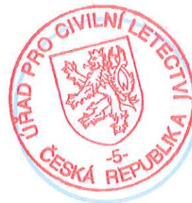
otisk úředního razítka